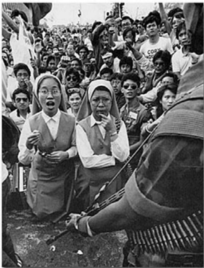
Religiosas rezam o rosário, nas Filipinas, em uma das várias manifestações que derrubaram pacificamente o ditador Ferdinando Marcos.

O historiador dominicano frei William Hinnebush (1908-1981), certa vez escreveu: “toda reforma e toda restauração na Ordem dos Pregadores foi levada a cabo quando houve uma renovação do espírito apostólico-contemplativo” ( Renewal in the Spirit of Saint Dominic , Washington, Dominicana, 1968, p. 6). Tal consideração é muito importante de ser recordada neste mês de outubro, mês missionário.