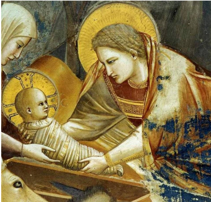
Giotto, Natività, Pádua, Capela Scrovegni (sec. XIV)

Santo Tomás de Aquino, em sua famosa Catena Aurea , ao comentar trecho do evangelho segundo Lucas, cita (várias vezes) o famoso autor monástico inglês São Beda, o venerável. O santo monge, certa vez, escreveu: “Mas até o fim dos tempos, o Senhor não deixa de ser concebido em Nazaré, de nascer em Belém, sempre que algum de seus ouvintes, tomando a farinha da Palavra, faz para ele uma casa de pão eterno”.